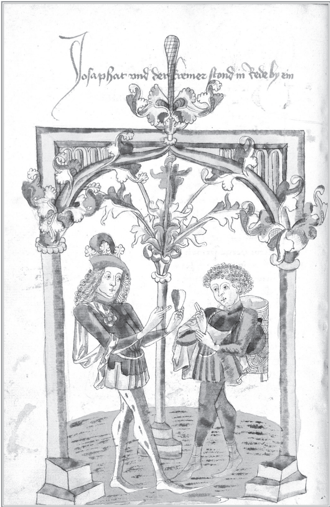
Josaphat en discussion avec Barlaam déguisé en marchand au sujet d'une pierre précieuse.